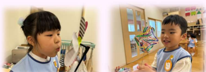
回ると〇に見えるね!